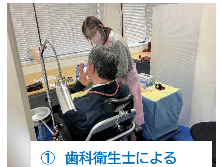
① 歯科衛生士による ブラッシング指導